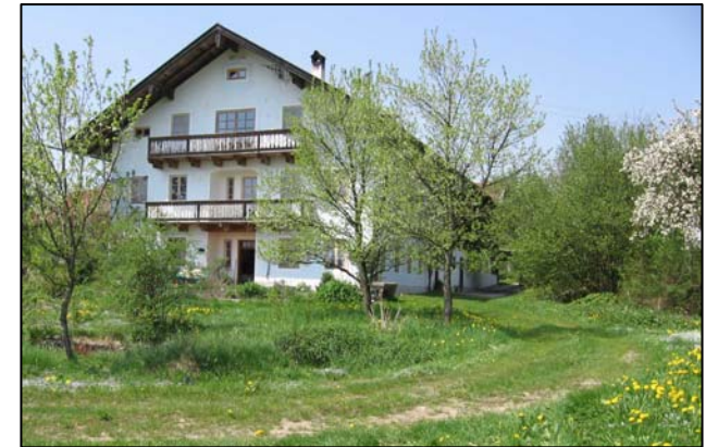
Frontansicht (Ferienwohnung im Dachgeschoss)

Schöne, großzügige Ferienwohnung mit herrlichem Simsseeblick und Alpenpanorama.