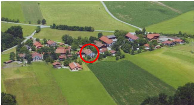
Innthal von oben (Reimprechtthof rot umkreist)

Verbringen Sie einen entspannten Urlaub in einem exquisiten Wohnumfeld inmitten der Natur!