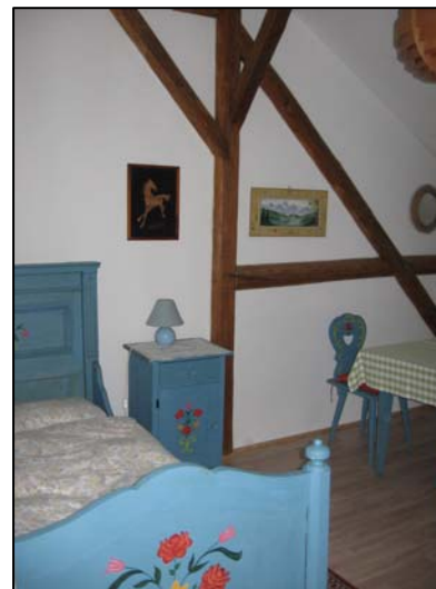
Schlafzimmer mit handbemalten Bauernmöbeln

Die Raumhöhe von bis zu 4,80 Metern und die große Panorama-Türfront zum eigenen Balkon lassen Ihre Blicke immer in die Weite schweifen!