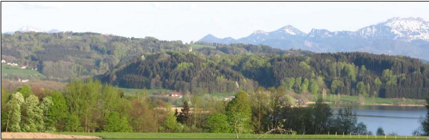
Panoramablick vom Balkon (links Ratzinger Höhe, rechts Kampenwand und Simssee)

Genießen Sie Ihren Feriendaufenthalt in der ca. 115 m 2 großen, neu ausgebauten Dachgeschosswohnung im „Reimprecht“-Bauernhaus. Der Bauernhof, der derzeit landwirtschaftlich nur sehr eingeschränkt bewirtschaftet wird, liegt inmitten von Obstwiesen mit freiem Ausblick auf Simssee, Ratzinger Höhe und Chiemgauer Alpen.