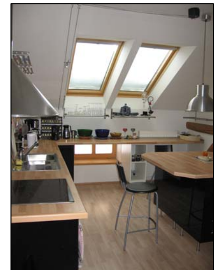
komplett ausgestattete Essküche